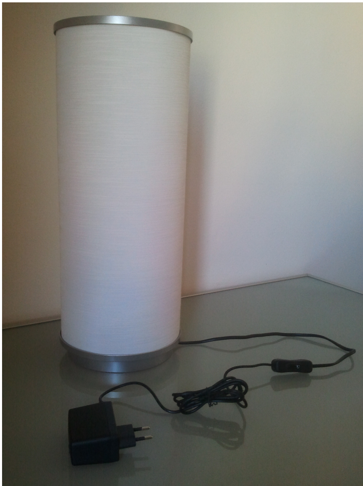
Figura 4 - Montaggio completo

Appoggiare il coperchio e fissare relativo tappo (ulteriori dettagli nella guida Ikea di Vidja (p.9) )