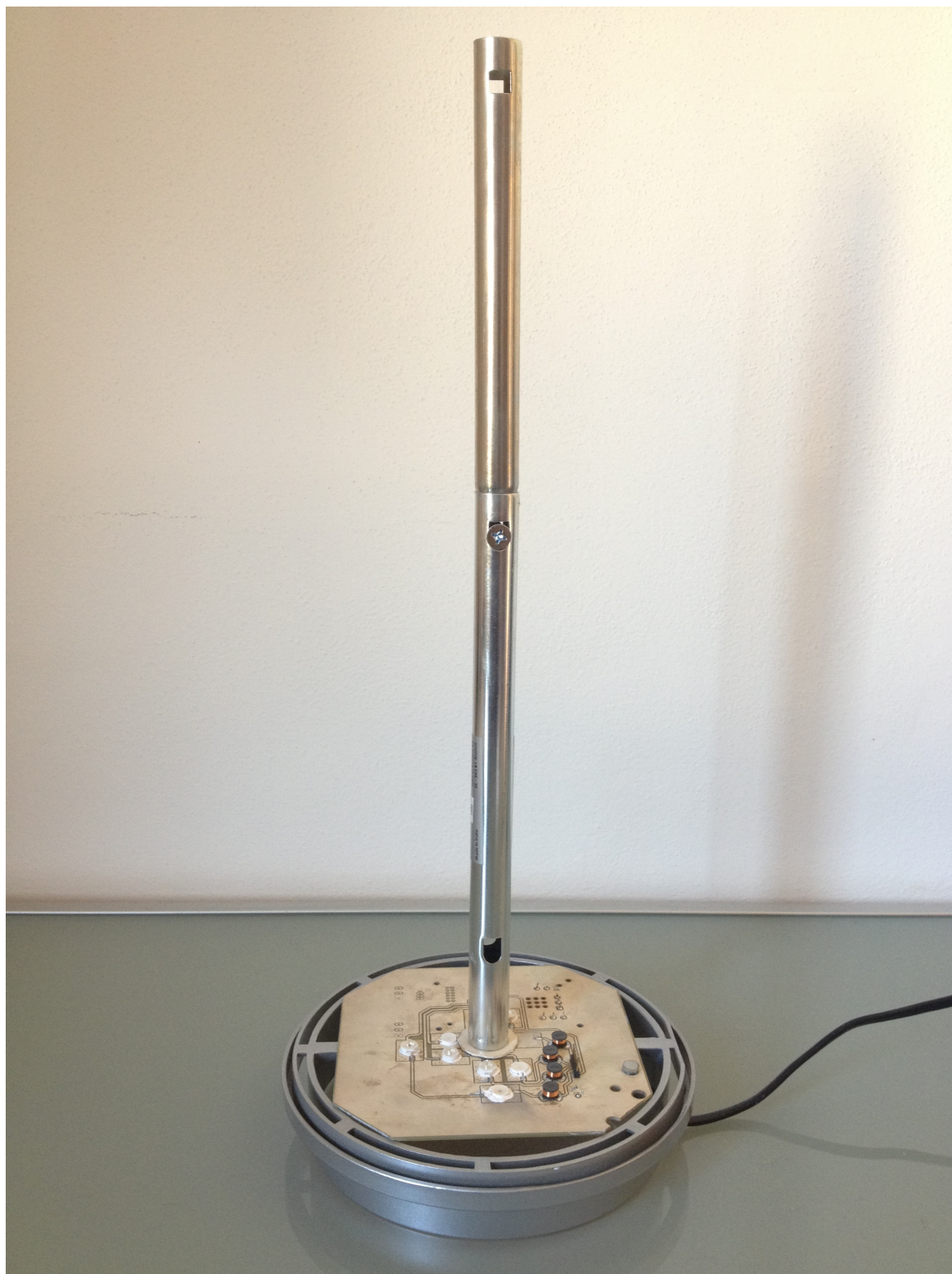
Figura 2 - Stelo su base Lampada

Avvitare la stelo al bullone e stringere a mano