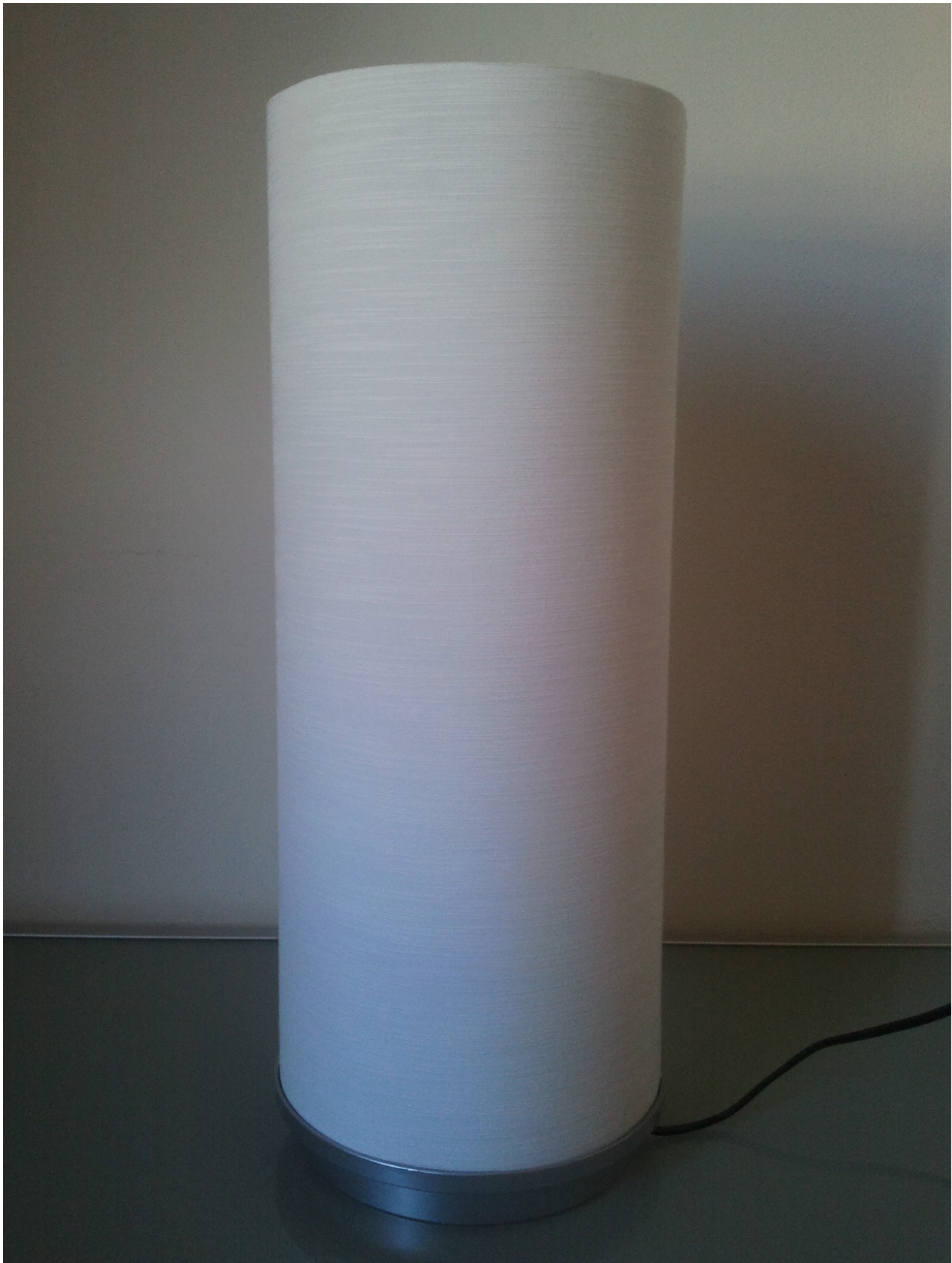
Figura 3 - Paralume

Appoggiare il paralume nella sede (ulteriori dettagli nella guida Ikea di Vidja (p.7,8) )